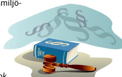
Bild 1. Lagbok.

Förutom de krav som beskrivs i detta dokument ska även arbetsmiljö- och annan tillämplig lagstiftning beaktas.