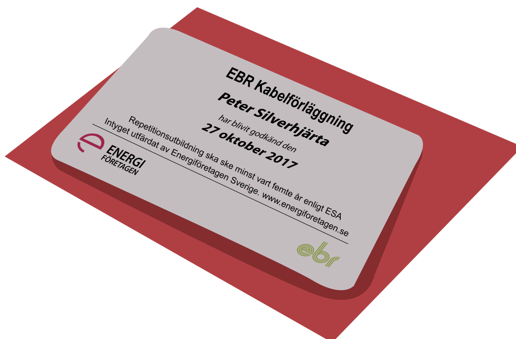
Bild 2. Exempel på utbildningsbevis.

Personer som utför arbeten med kabelförläggning ska ha genomgått utbildning och tillgjort sig kunskap enligt gällande dokument, Krav vid kabelförläggning. Denna kunskap ska kunna styrkas med EBR utbildningsintyg från utbildningen EBR Kabelförläggning.